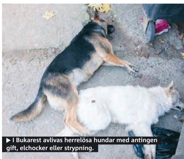
► I Bukarest avlivas herrelösa hundar med antingen gift, elchocker eller strypning.