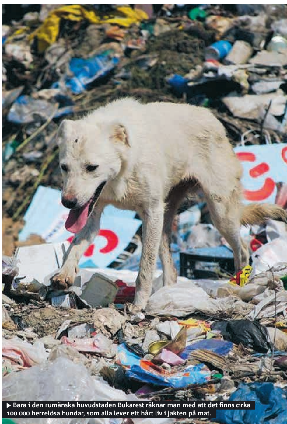
► Bara i den rumänska huvudstaden Bukarest räknar man med att det finns cirka 100 000 herrelösa hundar, som alla lever ett hårt liv i jakten på mat.

Efter ett parlamentsbeslut i Rumänien i november står det klart att det åter kan bli lagligt att döda landets många hemlösa hundar. Nu väntar bara presidentens underskrift.